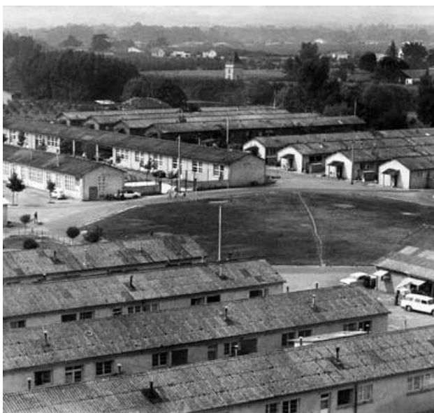
Le camp de Sainte Livrade/Lot en 1956