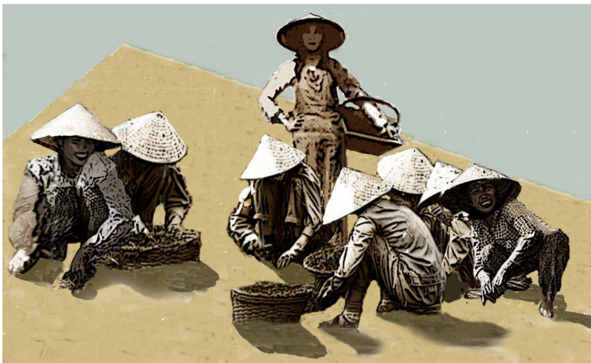
Les Mères d'origine vietnamienne travaillent dans les champs des haricots pour subvenir les enfants.