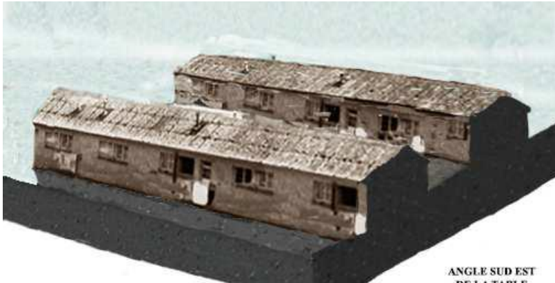
ANGLE SUD EST DE LA TABLE

* Construction d'un monument d'art, Plan-Relief du CAFI, représentant les mères vietnamiennes au travail dans les champs et les bâtiments vétustes servant d'habitation pour les Rapatriés d'Indochine arrivés en 1956 dans ce camp de transit provisoire qui dure plus de 60 ans à la mémoire de ces Rapatriés d'Indochine oubliés par l'Histoire