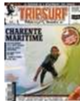
Trip Surf 126