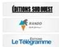
Editions Sud Ouest